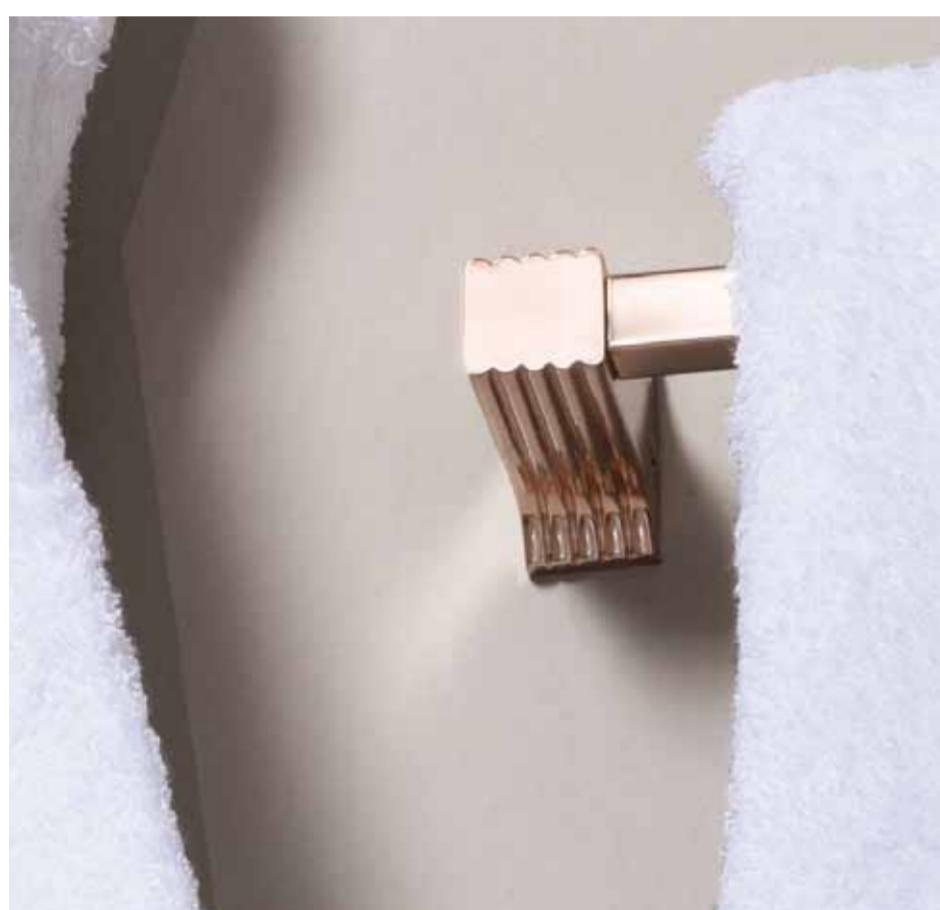
Portasalviette Towel rail Porte serviette