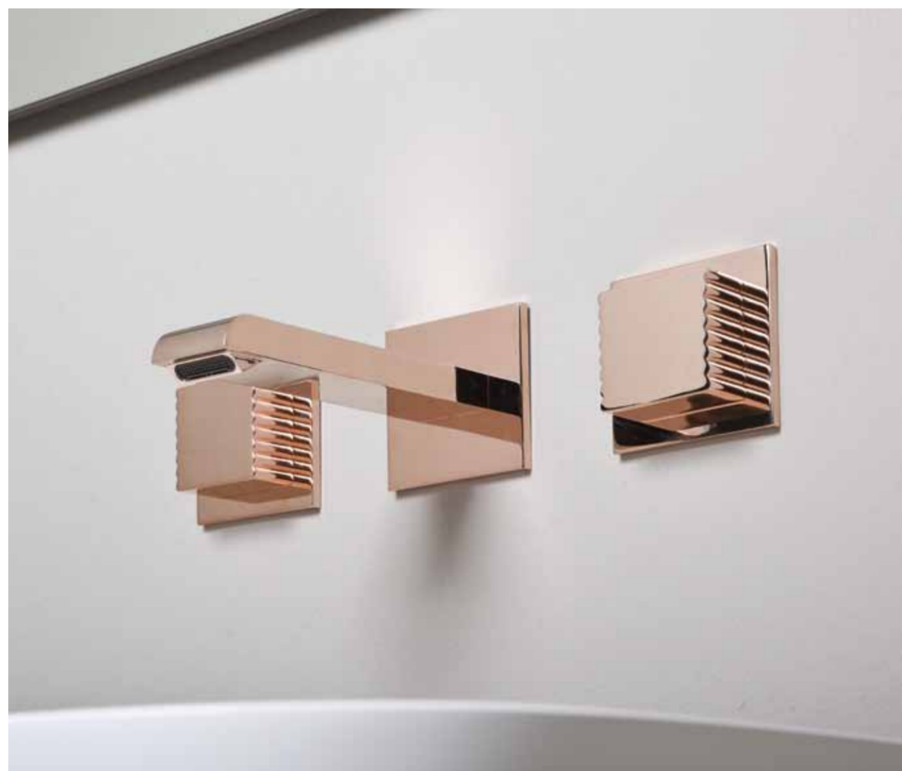
Gruppo per lavabo per installazione da incasso a parete. Concealed wall-mounted twin-control washbasin mixer. Mélangeur à encastrer pour lavabo

Gruppo tradizionale per lavabo, su mobile e lavabo Serie XL by Casabath Three-hole washbasin mixer low spout, furnishings XL Collection by Casabath Mélangeur de lavabo 3 trous, meuble et lavabo Collection XL produit par Casabath