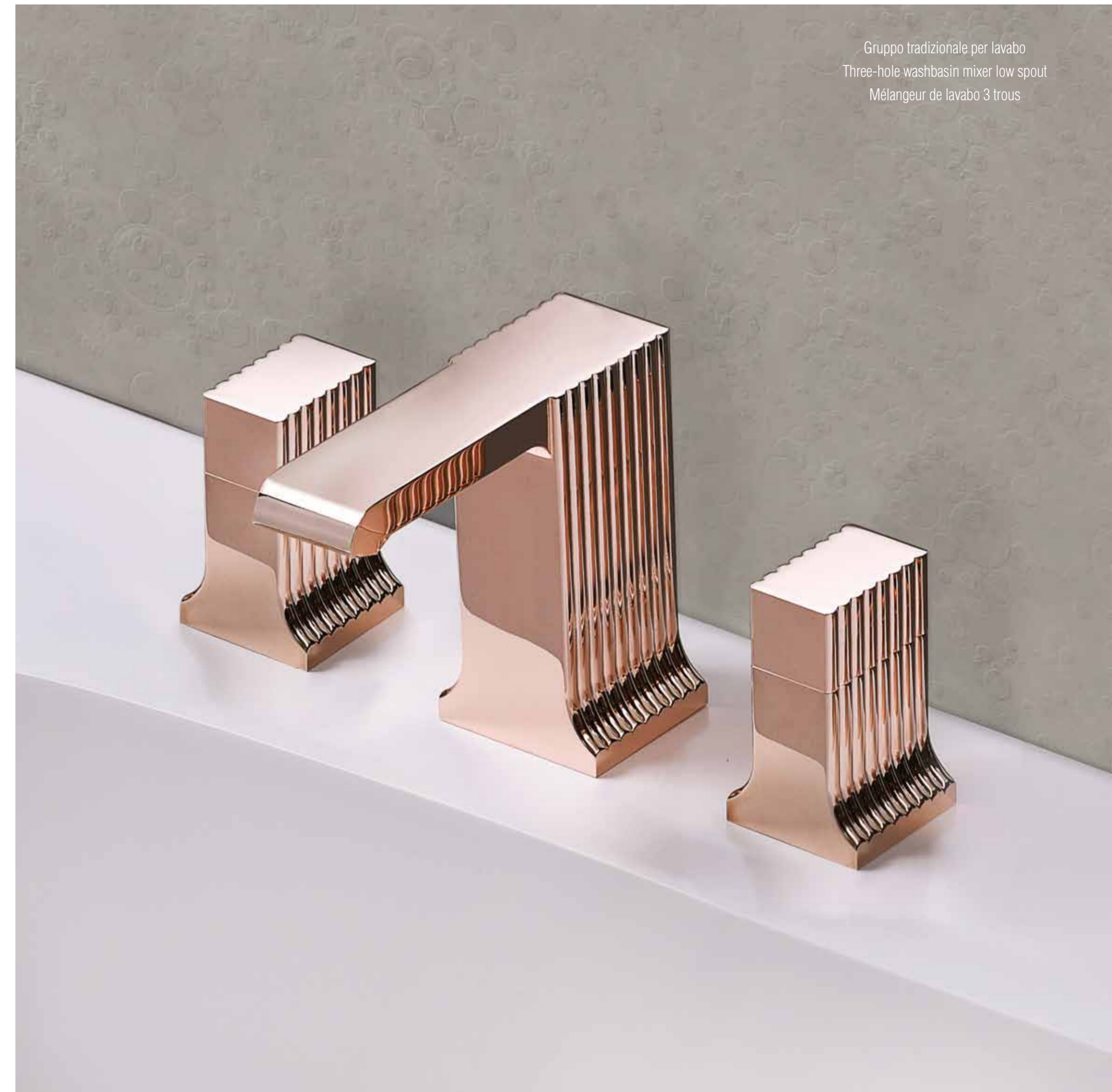
Gruppo tradizionale per lavabo Three-hole washbasin mixer low spout Mélangeur de lavabo 3 trous

Obtenu par un alliage d'or et de cuivre, cette nouvelle finition de prestige, plus discrète que l'or jaune, est plus dans goût du moment. Cette alliage très résistant dans le temps, ne s'oxyde pas en raison de sa forte présence en or, et est de plus antibactérien grâce au cuivre qui entre dans sa composition. En outre, il élimine complètement la présence de chrome hexavalent, objet de débat sur la pollution et sur les risques sanitaires.