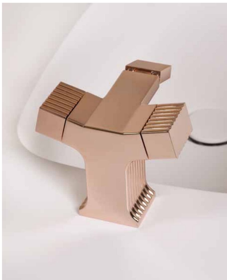
Gruppo monoforo per bidet Single-hole bidet mixer Mélangeur de bidet monotrou