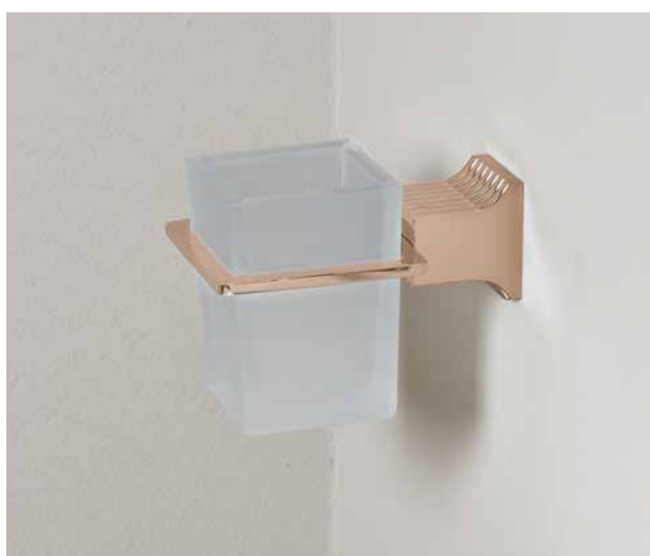
Portabicchiere con bicchiere in vetro satinato Tumbler holder with glass tumbler Porte-verre