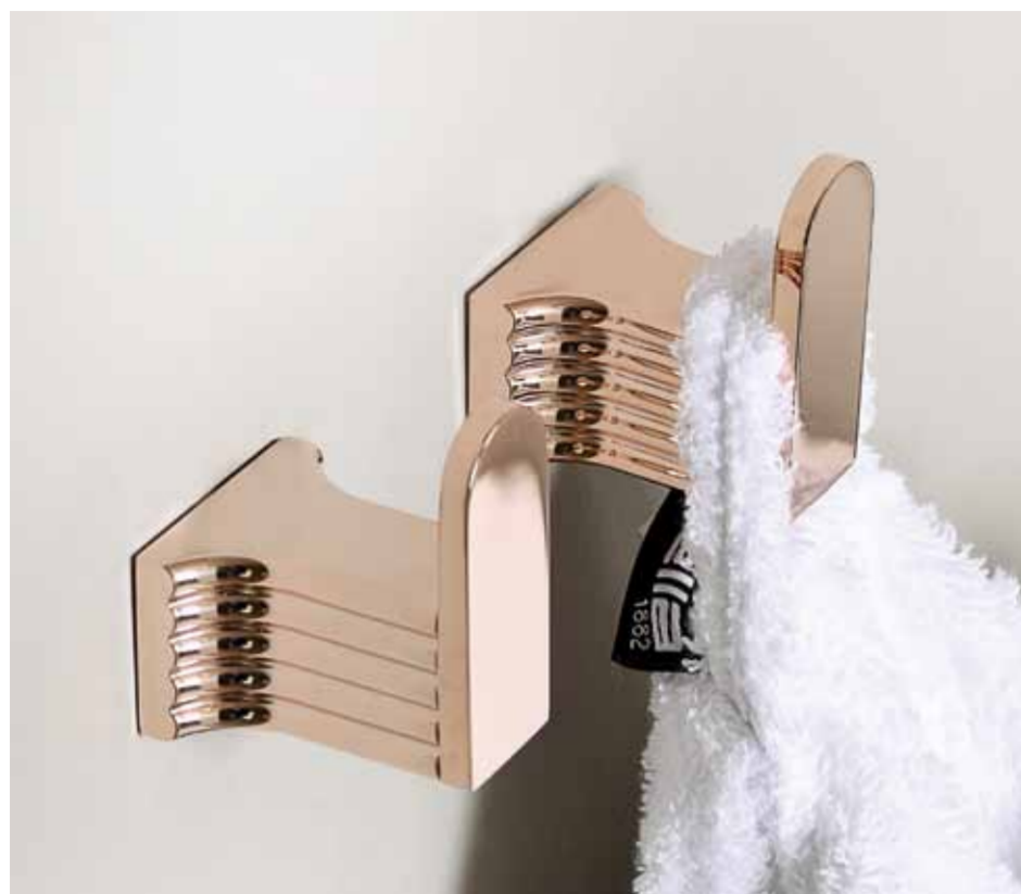
Gancio appendiabiti Hook Porte-peignor