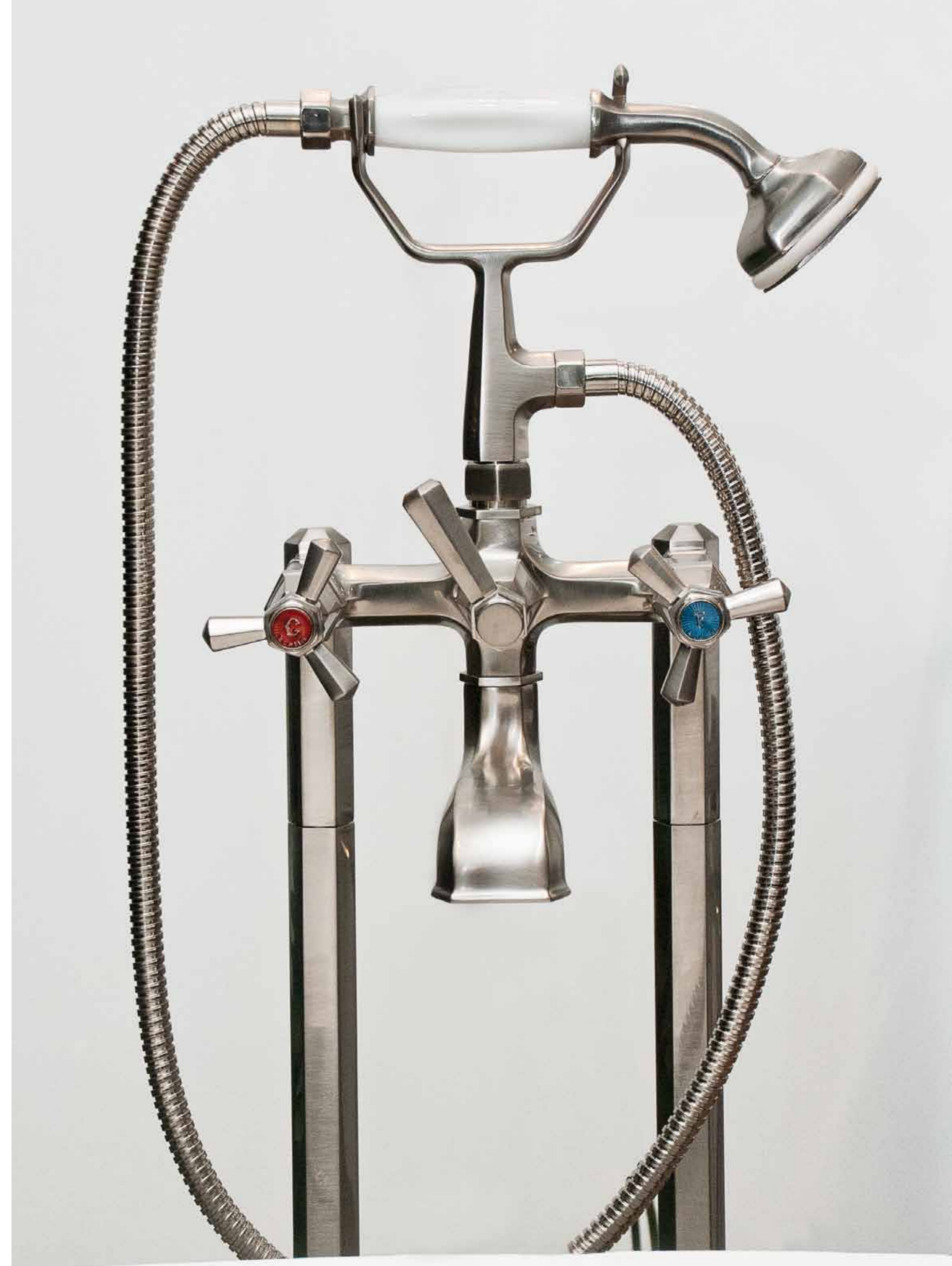
Eccelsa 3274/306 Nichel Spazzolato | Nickel Matte | Nickel Mat