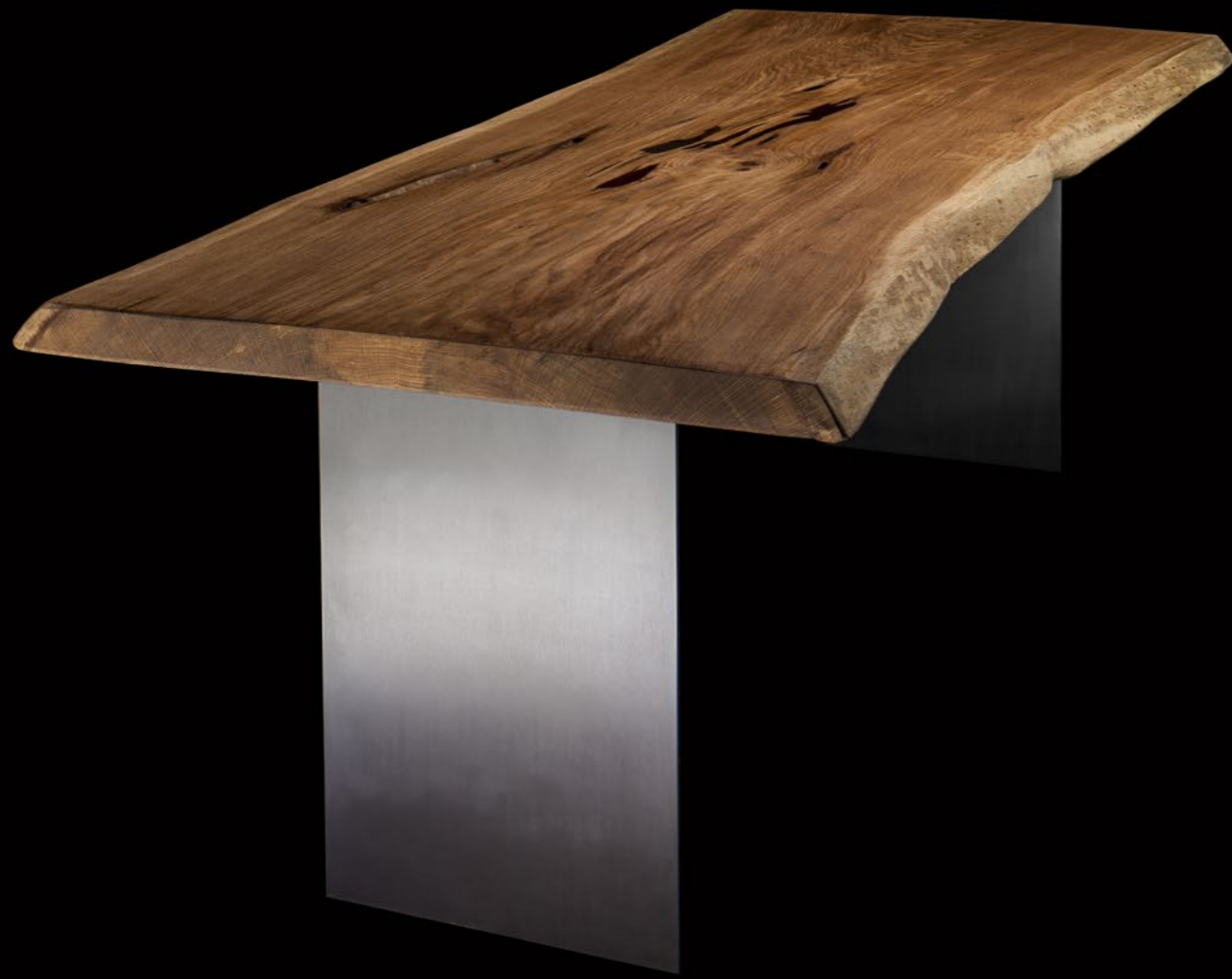
Rovere, collezione Unica, 180 anni, dim. 260x100 cm