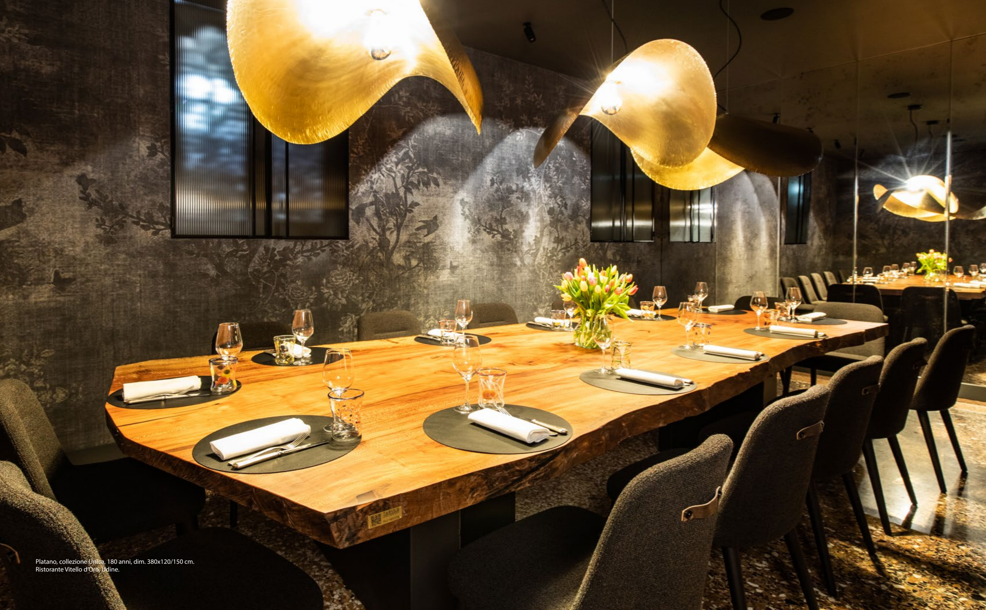
Platano, collezione Unica, 180 anni, dim. 380x120/150 cm. Ristorante Vitello d'Oro, Udine.