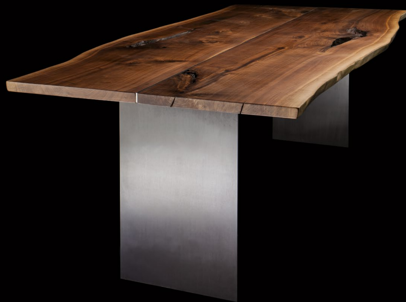
Noce Canaletto Pennsylvania, collezione Plurima, 80-100 anni, dimensioni 230x95-110 cm