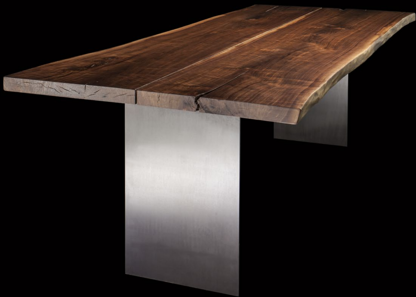
Noce Canaletto Pennsylvania, collezione Plurima, 80-100 anni, dim. 250x90 cm