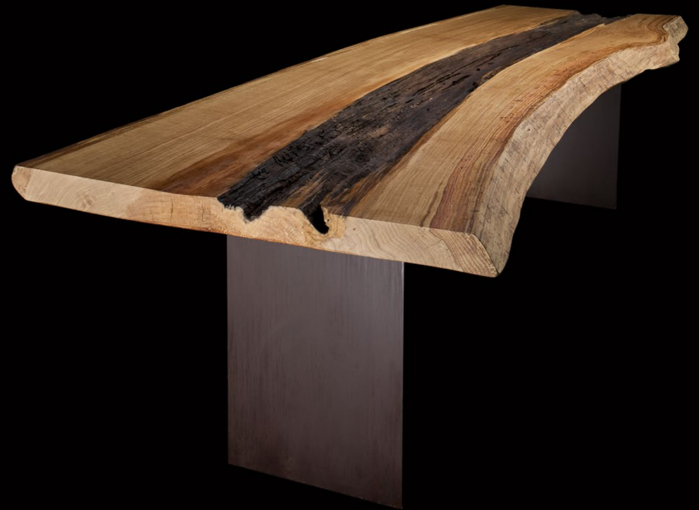
Rovere, collezione Unica, 180 anni, dim. 320x85 cm