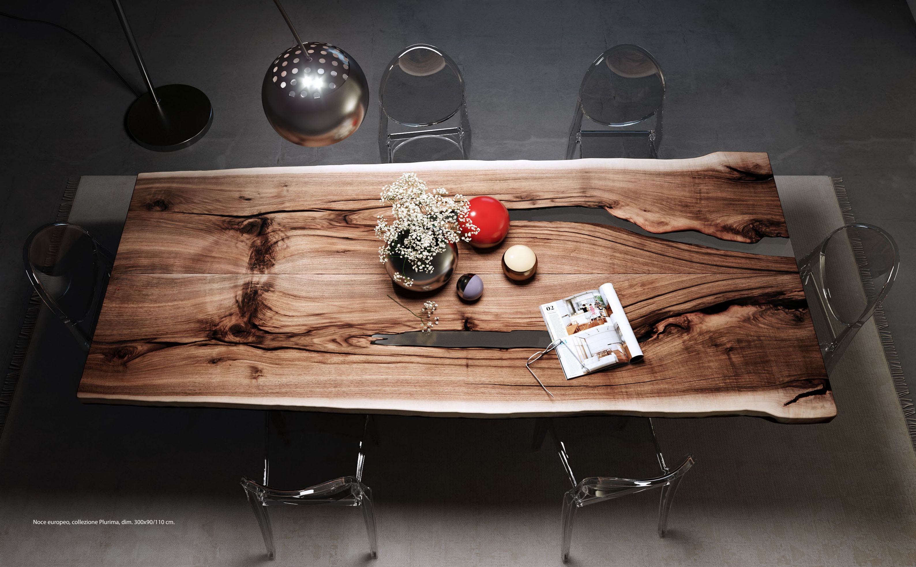
Noce europeo, collezione Plurima, dim. 300x90/110 cm.