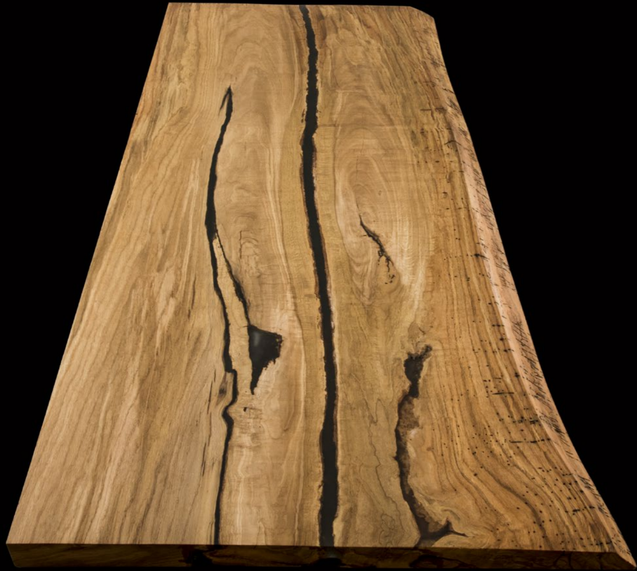
Rovere, collezione Unica, 180 anni, dim. 240x85 cm