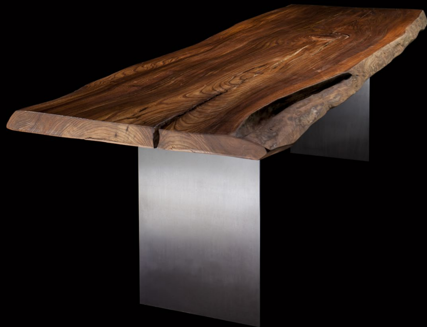
Olmo, collezione Unica, 150 anni, dim. 310x80 cm