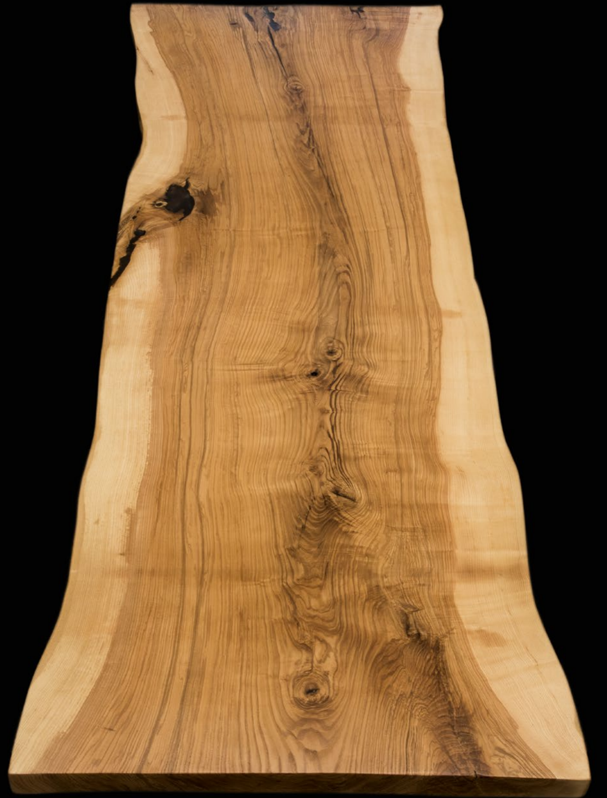
Frassino, collezione Unica, 130 anni, dim. 330x100 cm