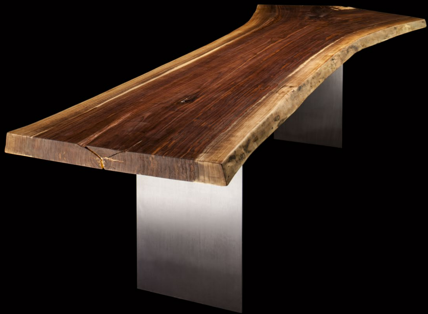
Noce Canaletto, collezione Unica, 120 anni, dim. 310x85 cm